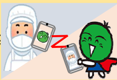
【遠隔調査イメージ】