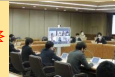
【オンライン会議開催】