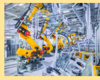
【イノベーションを促進】