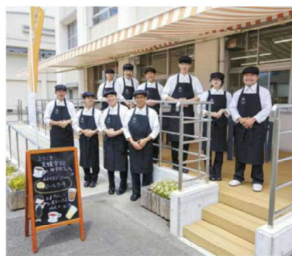
職業スキル向上と地域交流の場 「支援学校みまカフェ」

早期から一人ひとりの適性を見いだし、伸ばすことで、将来の社会的・職業的自立をめざした教育を推進します。