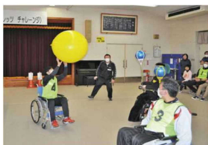
風船バレーで地域交流

障がいの種別や程度に関わらず、学齢期を通じて、文化・芸術・スポーツに親しみ、楽しむ機会を増やし、生涯にわたって、一人ひとりが個性や能力を発揮しながら、生活を豊かにすることのできる教育を推進します。