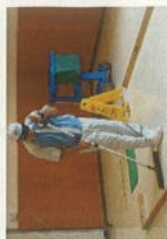
技能検定（ビルメン）