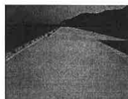
牟岐漁港 耐震強化岸壁