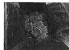
給食用のハモフライ