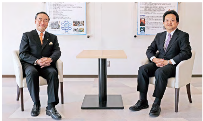
●「基本的な感染対策を継続することが重要です」と西岡さん。

高齢になるほど 重症化率が高まる傾向 ■知事 昨年から猛威を振るっている新型コロナウイルス感染症は、改めてどのような病気のようでしょうか? ■西岡 2019年12月に中国の湖北省武漢市で発生した感染症です。新型コロナウイルスは、インフルエンザと比べて同じくらいの感染力があることに加え、肺炎を起こしやすく致死率が高いという非常に厄介な特徴を持っています。 ■知事 高齢の方や既往症のある人は特に重症化のリスクが高くなるかと、若い方は無症状のケースが多いといった話をよく耳にしますが、専門家はどのように捉えていますか? ■西岡 年齢ごとに重症化率