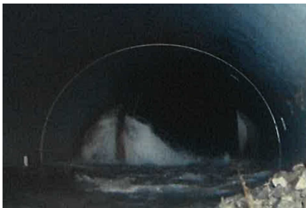
事故による河川水流入状況