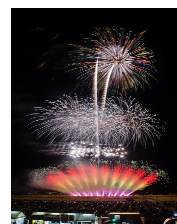
「にし阿波の花火」全国花火師競技大会