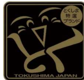
とくしま特選ブランド