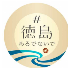
「#徳島あるでないでキャンペーン」ロゴ