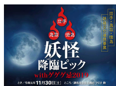
妖怪降臨ピックwithゲゲゲ忌（東京都調布市）