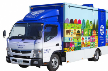
でり・ぱりキッチン阿波ふうど号