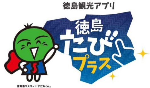
徳島県観光アプリ「徳島たびプラス」