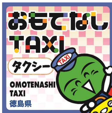
おもてなしタクシーロゴ