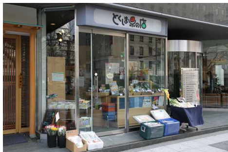
大阪「とくしまの店」