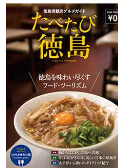
観光グルメガイド「たべたび徳島」