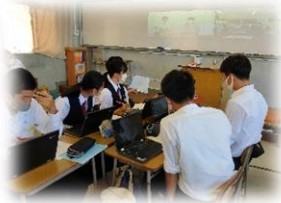
オンラインミーティング chromebook 活用