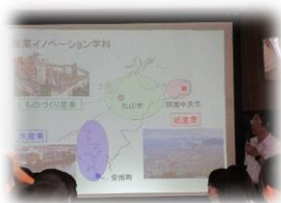
大学出張講義 (写真：令和元年度)