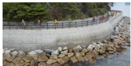
サイクリング推進事業 with 松山北中島分校