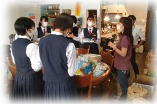
Food Drive with 子ども食堂