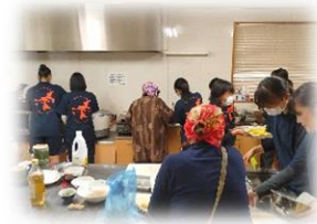
「郷土料理」講習会 地域交流