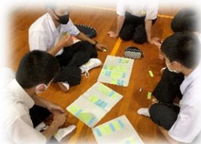
「総合的な探求の時間」 SDGs活動