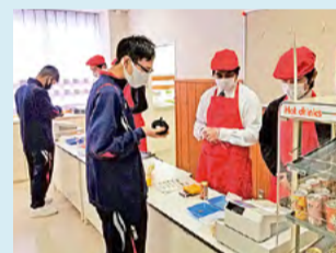
●みなと高等学園 生徒が運営する校内コンビニ「ゆめみずき」