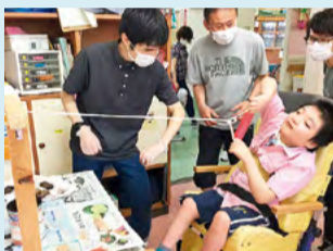
●鴨島支援学校 リサイクル・スマホ立ての色付け