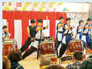
●国府支援学校 地域での和太鼓演奏(部活動)