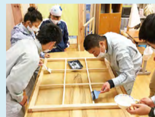
●阿南支援学校 竹紙のパーティション作り