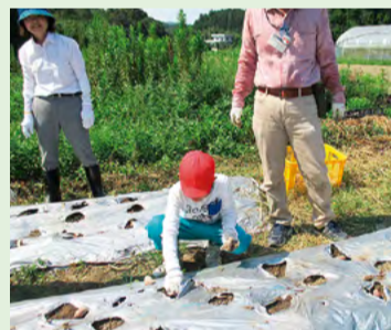
●近隣施設の農福連携活動への参加

児童生徒数の増加により校舎が狭くなっている上、老朽化も進んでいる国府支援学校については、国が策定する新たな「設置基準」に対応するとともに、全ての子どもたちが障がいの種類や程度に関わらず、地域社会との関わりをさらに深められるよう、ダイバーシティの先導モデルとして機能強化を図ります。