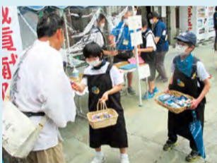
●阿南支援学校ひわさ分校 四国豊場場所でのお接待