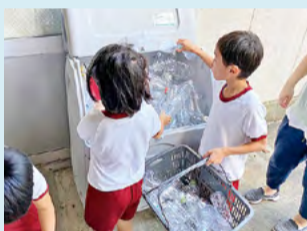
●池田支援学校 ペットボトルのリサイクル活動