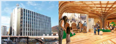
徳島中央警察署新庁舎 徳島木のおもちゃ美術館 (館内イメージ)

この中で「徳島ヴォルティス」は、長期のリーグ中断と再開後の過酷な試合日程という歴史的シーズンで遺憾なく実力を発揮「J2初優勝」の金字塔を打ち立て、7年ぶり「J1復帰」の快挙を果たし、県民に勇気と希望を与えてくれました。