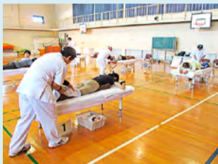
●徳島視覚支援学校 地域でのあんま体験会