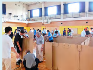
●徳島聴覚支援学校 地域の方と避難所設営訓練