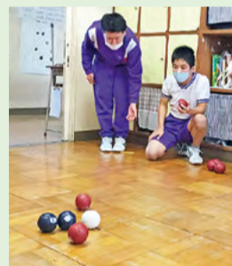
●授業でのポッチャの取り組み