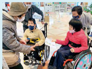
●ひのみね支援学校 地域スーパーでのエシカル消費啓発活動