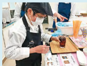
●池田支援学校美馬分校 支援学校「みまカフェ」