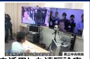
5Gを活用した遠隔診療