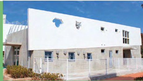
徳島県動物愛護管理センター「きずなの里」

徳島県には、人間に捨てられ、動物愛護管理センターにやってくる不幸な犬・猫がたくさんいます。当センターが開所した平成15年度に收容された犬・猫の数は、10,513頭で、殺処分数は10,263頭でした。昨年度に收容された犬・猫の数は、1,467頭で、殺処分数は752頭。開所当時に比べれば、殺処分数は10分の1以下までに減少しましたが、今もなお、これだけ多くの命が收容され、殺処分されています。