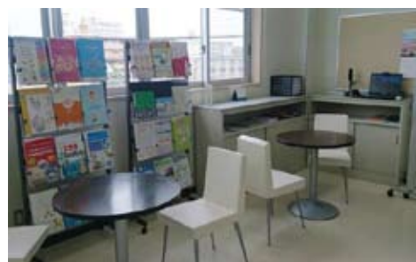
▲資料&ツール体験コーナー

場 所 : 徳島市南島田町2-25（駐車場あり） （旧徳島テクノスクール2階） 電 話 : 090-3187-9845 メール : info@tokushima-telework.jp 開館時間 : 平日 午前10時から午後5時まで ホームページ : https://www.tokushima-telework.jp