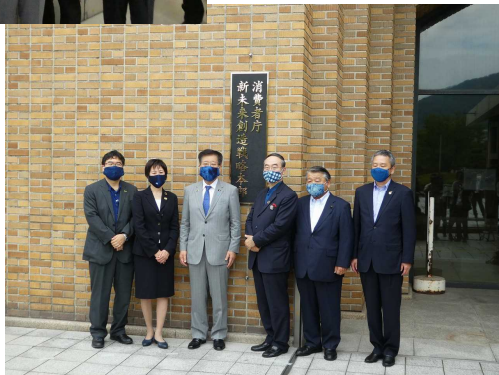
写真) 開設セレモニー

戦略本部が未来に向けた消費者行政の「発展・創造」の場となるよう、本県を実証フィールドとした新たなモデルプロジェクトの推進と、成果の全国展開等を支援していきます！