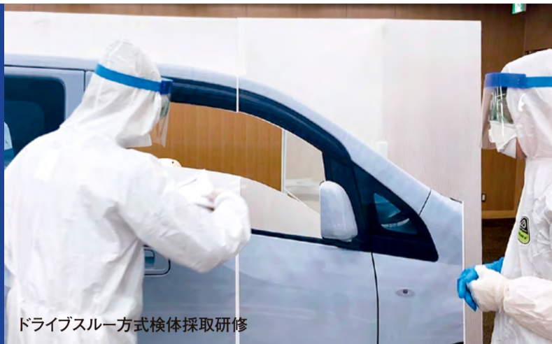
ドライブスルー方式検体採取研修