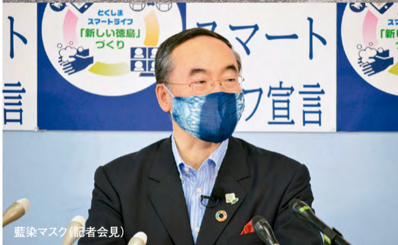
藍染マスク(記者会見)