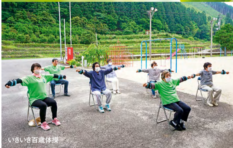
いきいき百歳体操