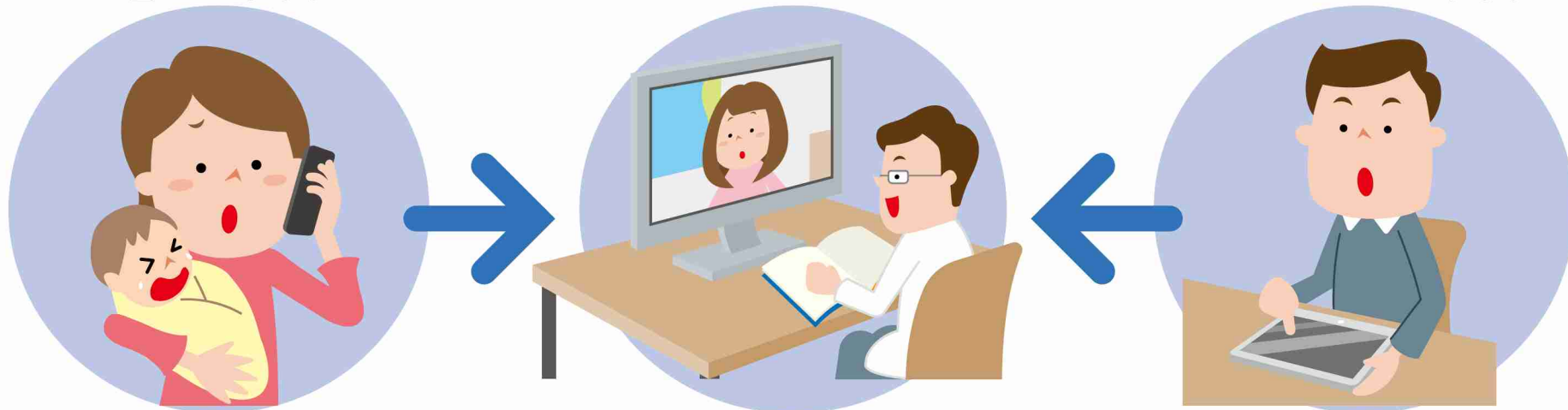
タブレットで受診