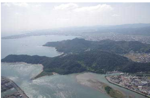
日の峰大神子風致地区

平成30年度末における県下の風致地区の指定状況及び平成30年度中の風致地区内における許可等の件数は表4-2-3のとおりとなっています。