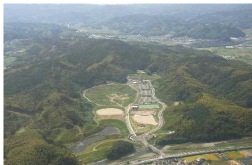
南部健康運動公園

また、都市緑化に対する意識の向上を図るため、官民協働により花壇づくりを進める「みどりのキャンパスプロジェクト事業」や「暮らしの緑化推進絵画コンクール」の開催により普及啓発を進めています。