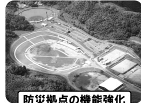
防災拠点の機能強化