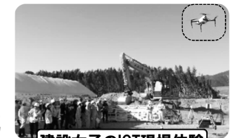
建設女子のICT現場体験