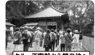
クルーズ客船から観光地へ