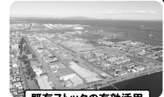
既存ストックの有効活用