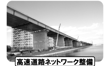
高速道路ネットワーク整備