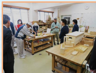
3年生加工デザイン