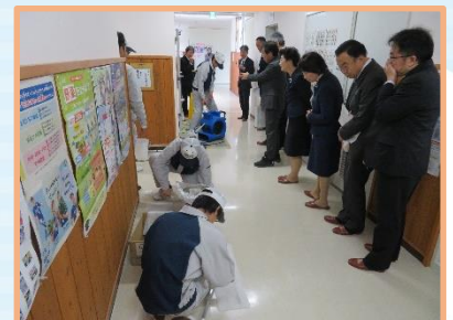
3年生ビルメンテナンス