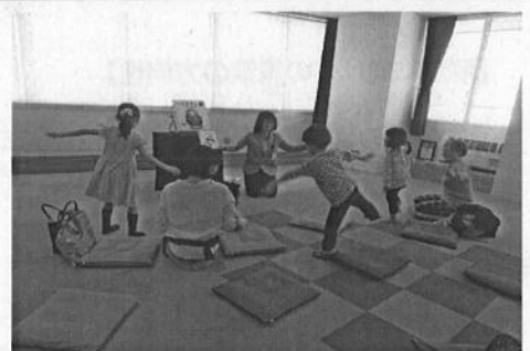
五感全てで読書を楽しめるのがアニメーションの魅力！

徳島市立図書館は平成24年度の徳島駅前のアミコビル移転当初から、蔵書の充実に加え、読み聞かせや講演などのイベントを年間800回以上開催するなど、利用者促進に向けた多彩な取組が行われています。平成30年度には2年連続で貸出者数・貸出冊数ともに最多を更新しています。また、子供の読書への興味関心を高める取組として、YA（ヤングアダルト）ボランティアによるイベント開催や「子ども司書講座」の開催、他にも読書のアニメーションをふんだんに取り入れたブックトーク等、本との出会いを創出する図書館づくりが行われています。