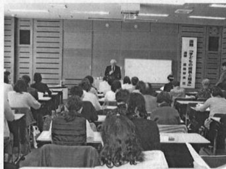
児童文学作家講演会開催。熱心な質問が相次ぎました。

県内の11団体が加入しており、個々の団体の持つ子供の読書活動推進のための情報の交換や、ボランティアとしての資質及び技術力の向上、若手ボランティアの育成を目的とした講演会や研修会を精力的に企画しています。