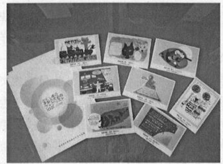
優秀作品をカード化！園・学校での読書啓発に活用。

また、優秀作品は県内の図書館等で巡回展示され、県民の皆様を楽しみながら読書の重要性について考えていただけるようになっていきます。