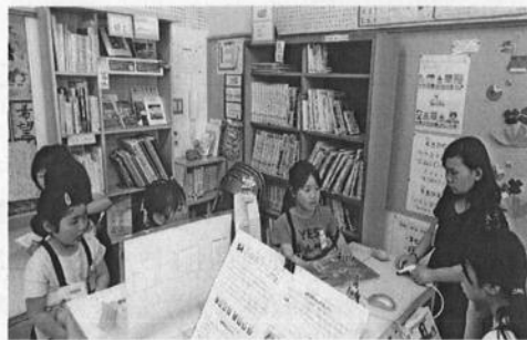
図書の貸出は私におまかせ！ハイ次の方どうぞー

平成23年から図書館サポーターが配置されている鳴門市の撫養小学校では、平成27年度末現在、児童の図書貸出数が約9倍に増加しています。希望図書の購入に際しては児童によるプレゼンが行われたり、読書週間の期間には児童発案の手作り賞品が抽選で当たるイベントが開催されたりと、児童の興味関心を引き付ける読書活動が実践されています。また、児童を中心とする図書委員会活動も活発で、学校の図書館機能が十分に活用されています。平成31年度には子供の読書活動優秀実践校として、文部科学大臣表彰を受賞しています。