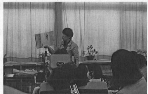
次は何が起きる？子供たちの瞳はキラキラしています。

また、授業にも「読書」の機会を積極的に取り入れています。自立活動を主とした学習形態の学級では、個別の指導計画を作成し、絵本の読み聞かせや、エプロシアターの他、デジタル教材も積極的に活用し読書に親しむ時間を設けています。教科学習を行っている学級では、図書室の資料を活用し、テーマ研究を行い文化祭等で発表を行うなど、子供の障がいの種別や程度にあわせた読書活動を展開しています。これらの取組が評価され平成28年度には子供の読書活動優秀実践校として、文部科学大臣表彰を受賞しています。