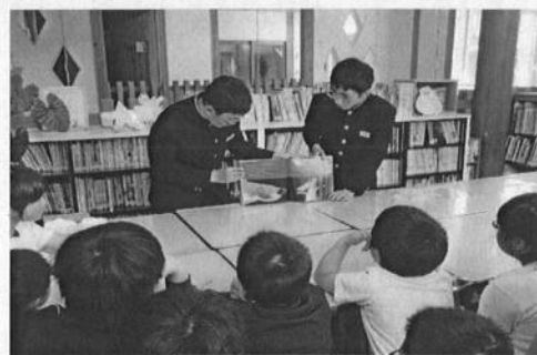
緊張の時間！けれども後輩たちの反応が嬉しい時間でもあります！！

「今度は、これ読んで！」小学生からのリクエストに応えることも回を追うごとに増えており、児童・生徒の読書への興味・関心を高める活動となっていることはもちろん、心と心を結ぶ特色ある素晴らしい取組となっています。