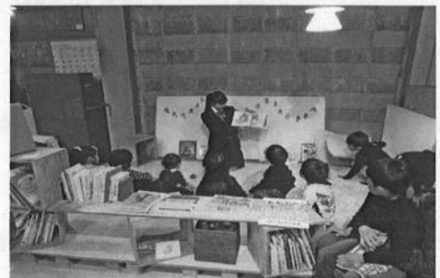
イベント会場での読み聞かせ初挑戦！ドキドキです。

高校生は実践を通して、自分たちの学びのアウトプットはもちろん読み聞かせ会に参加している子供の読書への興味関心を高める活動に取り組むとともに、次世代のリーダーとして親世代への読書啓発にも取り組んでいます。