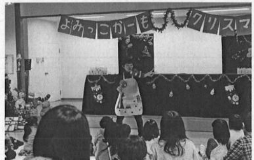
メンバー手作りの人形劇★毎年、新作上演しています。

平成22年に「絵本とおはなしの会」から活動を引き継ぎ「よみっこ★かーも」が結成されました。吉野川市鴨島公民館図書室を活動拠点に、12名のメンバーが活動しています。幅広い年齢層と多彩なスキルを持つメンバーで構成されており、絵本の読み聞かせやペープサート、エプロンシアター、手遊び歌などそれぞれの得意分野を活かした「おはなし会」が、毎月第2土曜日に開催されています。