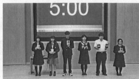
発表者による熱い書評を会場ぜひ御覧下さい！

徳島県では、平成27年から高校生大会を、平成29年からは中学生も参加するビブリオ大会が行われています。年々ビブリオ大会出場者数も増加しており、その気運は高まっています。また、県代表として全国大会で優秀な成績を収める生徒を輩出するなど、子供の読書活動推進において効果的な取組の一つとなっています。