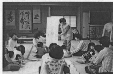
赤ちゃんたちは絵本が大好き！大型絵本に興味津津

「赤い屋根 上板」は、平成25年3月に結成されました。上板町内で活動する読み聞かせ団体や子育て支援グループ5団体が加入しています。この団体の取組は多岐にわたっていますが、特に力を注いでいるのが子供の読書活動の推進です。上板町のブックスタート事業のサポートの他、「ゆめ基金」を活用したお話会や講演会の開催、「上板あいく会」と連携し、上板中学校の学級文庫に寄贈する「アルミ缶文庫」は16年の長きにわたり継続されています。上板町の子供に充実した読書環境を提供しようと尽力されています。