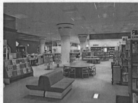
子供に合わせ低い書架を配置。広々空間です。

子供の読書支援としては、「こども読書手帳」の発行、パスファインダーの作成、ライトノベル等の中高校生向け図書の充実、インターシップの受け入れ等に取り組み、子供たちの読書へのモチベーションアップを図るとともに、総合的な学習の時間の学び支援や、キャリア観の育成にも力を注ぎ、多面的な読書支援を行っています。