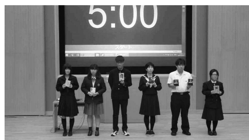
発表者による熱い書評を会場でぜひ御覧下さい！

徳島県では、平成27年から高校生大会を、平成29年からは中学生も参加するビブリオ大会が行われています。年々ビブリオ大会出場者数も増加しており、その気運は高まっています。また、県代表として全国大会で優秀な成績を収める生徒を輩出するなど、子供の読書活動推進において効果的な取組の一つとなっています。