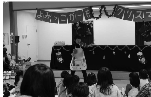
メンバー手作りの人形劇★毎年、新作上演しています。

また、12月のクリスマス会では、メンバーの手作りによる人形劇が開催され、日本中央テレビで放映されている「おはなしタイム」では、団体オリジナルの物語や紙芝居が実演されるなど、「よみっこ★かーも」と鴨島公民館図書室との連携により、地域の子どもたちにとって公民館図書室が身近な読書活動の場としての機能を発揮しています。