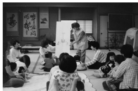
赤ちゃんたちは絵本が大好き！大型絵本に興味津津

「赤い屋根 上板」は、平成25年3月に結成されました。上板町内で活動する読み聞かせ団体や子育て支援グループ5団体が加入しています。この団体の取組は多岐にわたっていますが、特に力を注いでいるのが子供の読書活動の推進です。上板町のブックスタート事業のサポートの他、「ゆめ基金」を活用したお話会や講演会の開催、「上板あいく会」と連携し、上板中学校の学級文庫に寄贈する「アルミ缶文庫」は16年の長きにわたり継続されています。上板町の子供に充実した読書環境を提供しようと尽力されています。