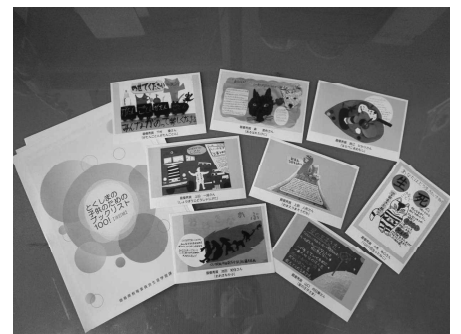
優秀作品をカード化！園・学校での読書啓発に活用。

また、優秀作品は県内の図書館等で巡回展示され、県民の皆様を楽しみながら読書の重要性について考えていただけるようになっています。