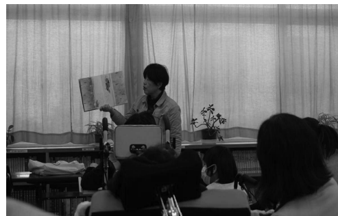
次は何が起きる？子供たちの瞳はキラキラしています。

学級では、図書室の資料を活用し、テーマ研究を行い文化祭等で発表を行うなど、子供の障がいの種別や程度にあわせた読書活動を展開しています。これらの取組が評価され平成28年度には子供の読書活動優秀実践校として、文部科学大臣表彰を受賞しています。