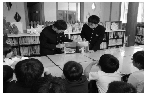
緊張の時間！けれども後輩たちの反応が嬉しい時間でもあります！！

「今度は、これ読んで！」小学生からのリクエストに応えることも回を追うごとに増えており、児童・生徒の読書への興味・関心を高める活動となっていることはもちろん、心と心を結ぶ特色ある素晴らしい取組となっています。