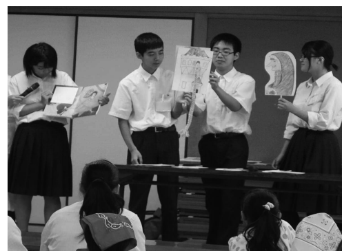
お腹の次は、手作り絵本で子供たちの心も満たします！

平成30年夏、川島公民館で、小学生を対象にした「絵本に出てくる料理」教室が開催されました。子ども講座の拡充に取り組む公民館事業の一環ですが、そのサポーターを務めたのは地域の繋がりがづくりに関心を持つ川島高校生です。当日のお料理作りの支援はもちろん、絵本の世界観を小さな子どもたちに体感してもらうため、事前に手作り絵本の作成に取り組んだり、読み聞かせの練習を重ねたりしました。事業後、高校生からは「子どもたちにわかりやすく伝えるための工夫ができた」「子どもたちが熱心に話を聞いてくれてうれしかった」等の意見が上がるなど、高校生自身が自分の読書活動について振り返る機会となったことはもちろん、絵本を通して、世代を超えた地域の繋がりが生まれる素晴らしい取組となっています。