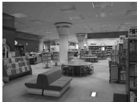
子供に合わせ低い書架を配置。広々空間です。

子供の読書支援としては、「こども読書手帳」の発行、パスファインダーの作成、ライトノベル等の中高生向け図書の充実、インターンシップの受け入れ等に取り組み、子供たちの読書へのモチベーションアップを図るとともに、総合的な学習の時間の学び支援や、キャリア観の育成にも力を注ぎ、多面的な読書支援を行っています。