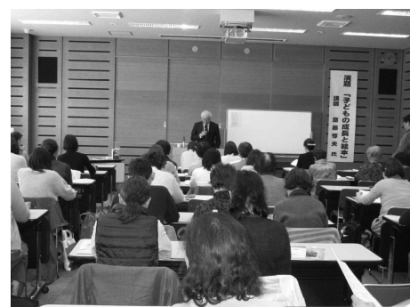
児童文学作家講演会開催。熱心な質問が相次ぎました。

県内の11団体が加入しており、個々の団体の持つ子供の読書活動推進のための情報の交換や、ボランティアとしての資質及び技術力の向上、若手ボランティアの育成を目的とした講演会や研修会を精力的に企画しています。