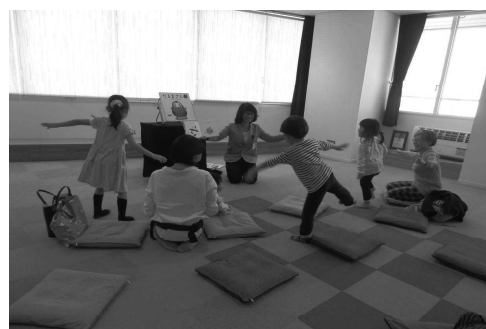
五感全てで読書を楽しめるのがアニメーションの魅力！

徳島市立図書館は平成24年度の徳島駅前のアミコビル移転当初から、蔵書の充実に加え、読み聞かせや講演などのイベントを年間800回以上開催するなど、利用者促進に向けた多彩な取組が行われています。平成30年度には2年連続で貸出者数・貸出冊数ともに最多を更新しています。また、子供の読書への興味関心を高める取組として、YA（ヤングアダルト）ボランティアによるイベント開催や「子ども司書講座」の開催、他にも読書のアニメーションをふんだんに取り入れたブックトーク等、本との出会いを創出する図書館づくりが行われています。