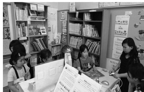
図書の貸出は私におまかせ！ハイ次の方どうぞー

希望図書の購入に際しては児童によるプレゼンが行われたり、読書週間の期間には児童発案の手作り賞品が抽選で当たるイベントが開催されたりと、児童の興味関心を引き付ける読書活動が実践されています。また、児童を中心とする図書委員会活動も活発で、学校の図書館機能が十分に活用されています。平成31年度には子供の読書活動優秀実践校として、文部科学大臣表彰を受賞しています。