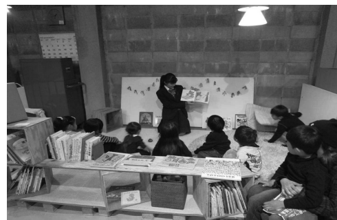
イベント会場での読み聞かせ初挑戦！ドキドキです。

高校生は実践を通して、自分たちの学びのアウトプットはもちろん読み聞かせ会に参加している子供の読書への興味関心を高める活動に取り組むとともに、次世代のリーダーとして親世代への読書啓発にも取り組んでいます。