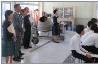
土木構造設計 「鉄筋コンクリート柱の設計」