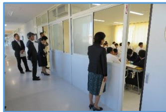
ロボット技術 「移動機構」