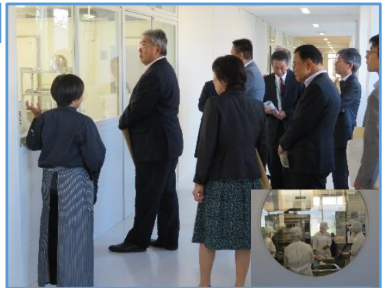
生活産業基礎 「食生活関連分野の産業と職業」