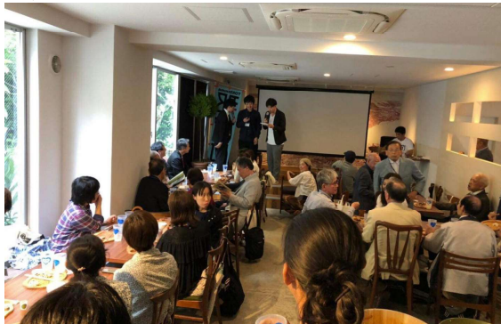
利用者目線に立ったレイアウト（1F）