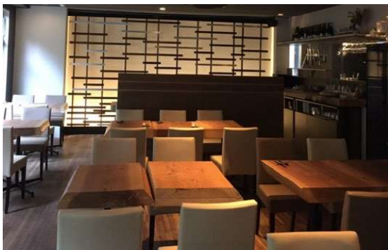
2～4名利用に適したレイアウト（2F）