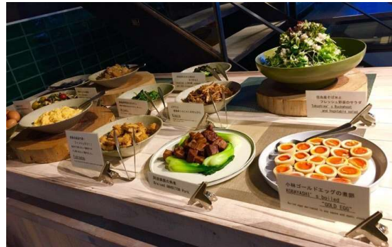
朝食の魅力アップ（1F）