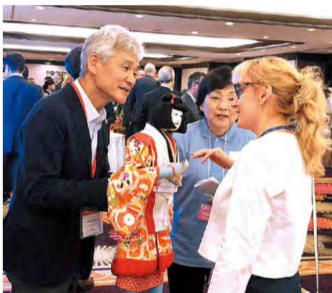
●阿波人形浄瑠璃など徳島の魅力をPR。