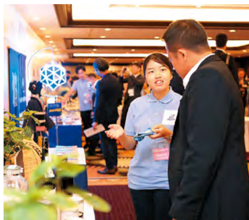
●阿波藍の歴史や文化を説明。