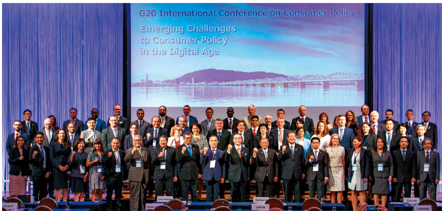
●38カ国・地域・機関の消費者行政実務者など、海外から約60名が参加。