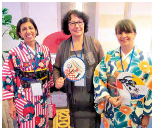
●参加者向け着物貸出と着付けサービスを実施。