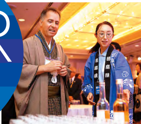
●地酒などを海外からの参加者に説明。