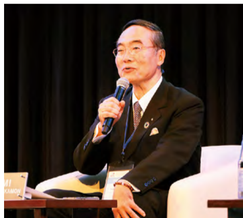
●徳島県の先進的な取り組みを紹介。