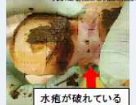
水疱が破れている