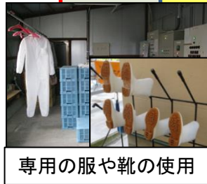
専用の服や靴の使用