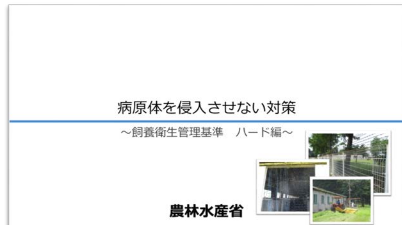
「病原体を侵入させない対策」