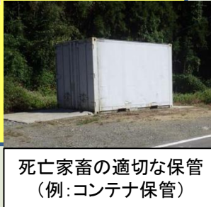
死亡家畜の適切な保管 (例: コンテナ保管)