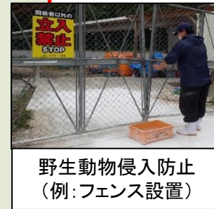
野生動物侵入防止 (例: フェンス設置)