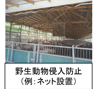
野生動物侵入防止 (例: ネット設置)