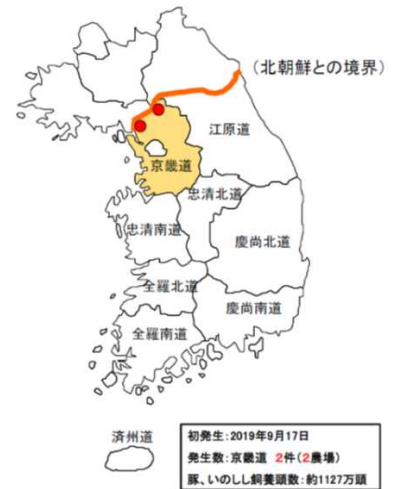
韓国におけるアフリカ豚コレラの発生状況

※ OIE報告、韓国畜産公費資料等の情報を元に作成 飼養頭数: FAO統計(2017)による