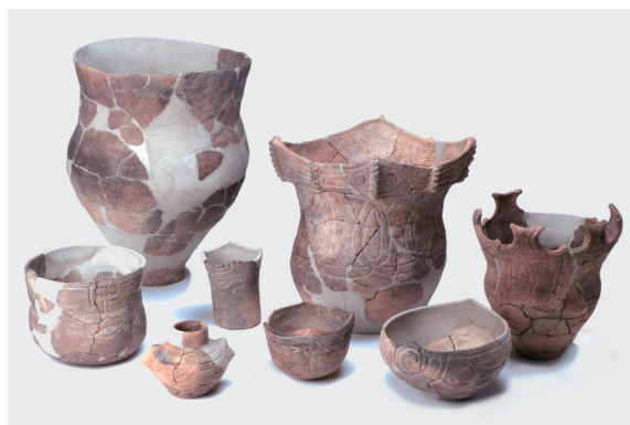
▲徳島の至宝 重要文化財が大集合！

※講演会は当初10月19日(土)のみの開催予定でしたが、 内容が変更となり19(土)・20(日)の2日間の開催となりました。