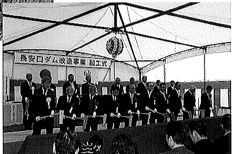
起工式（はつぐわ・くす玉開披）