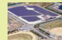
▲和田島太陽光 (小松島市) 2,000kW