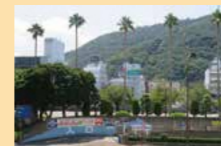
▲藍場町地下駐車場 (徳島市藍場町)

高速バス利用者の利便性向上に資するとともに、物産館の利用などにも幅広く利用されています。