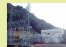
▲勝浦発電所 (正木ダム) 11,300kW