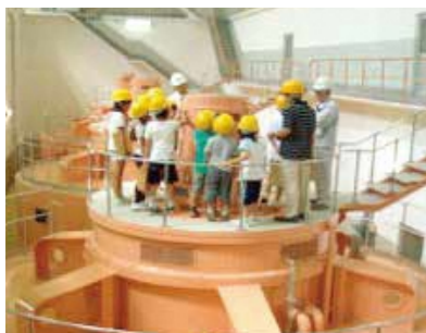
▲ 水力発電所施設見学会