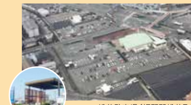
▲松茂駐車場 (板野郡松茂町)