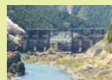
▲川口発電所 (川口ダム) 11,700kW