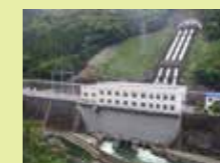
▲日野谷発電所 (長安口ダム) 62,000kW