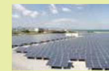
▲マリンピア沖洲太陽光 (徳島市) 2,000kW

2ヶ所の太陽光発電所では、それぞれ2,000kWを出力し、県内へ供給しています。また、和田島太陽光発電所では、災害時に近隣の広域避難施設へ電力を供給するシステムを有しています。