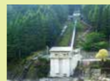
▲坂州発電所 (追立ダム) 2,500kW

全国的にも豊富な水量を有する本県の河川を利用し、計4ヶ所の水力発電所を設け、安定した電気を県内へ供給しています。