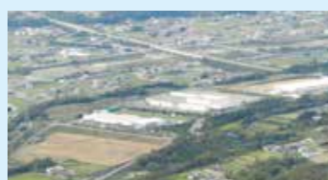
▲西長峰工業団地 (阿波市)

地域の産業基盤を整備するため、企業立地に必要な工業用地を造成しています。臨海部で1地区、内陸部で5地区の約182haを造成し、24の企業が立地しています。