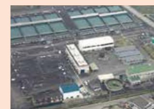
▲浄水場 (板野郡松茂町)

吉野川の支流である旧吉野川の表流水を取水し、浄水場で水処理を行ったのち、徳島市、鳴門市及び板野郡の各企業へ給水しています。