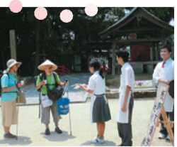
参道清掃でお接待 <池田支援学校美馬分校>