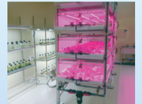
栽培室(LED照明による栽培棚)