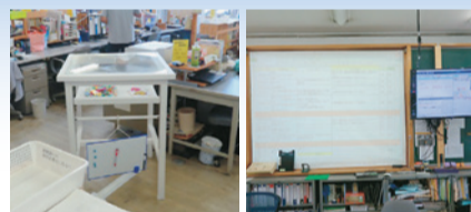
職員室の環境改善による業務効率の向上 ICT活用による業務改善

※プランはこちらからご覧いただけます。 http://hatarakikata.tokushima-ec.ed.jp