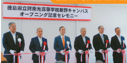
オープニング記念セミナー 令和元年6月5日(水)