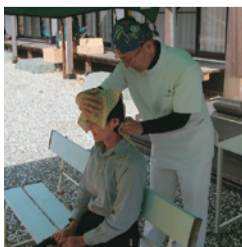
マッサージでお接待 <徳島視覚支援学校>