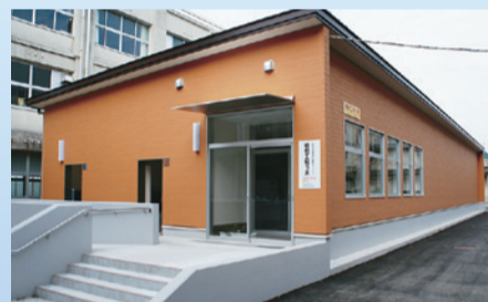
実習:「阿南市伊島の希少植物イシマサユリの培養」