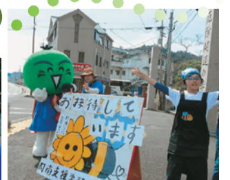
おもてなしの心でお接待 <阿南支援学校ひわさ分校>