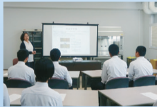
講義:「阿南の特産物と食」