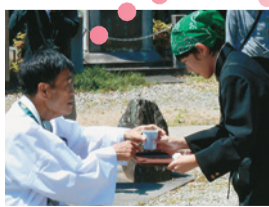
入れたての飲み物でお接待 <国府支援学校> <板野支援学校>