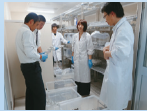
実験:「昆虫資源の食料利用」