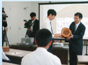
講義:「樹木・木材の基礎」