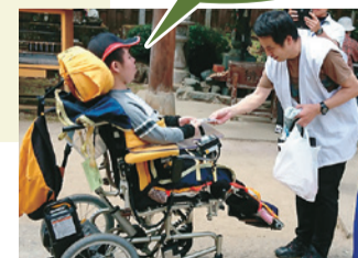
手作り作品でお接待 <鴨島支援学校>