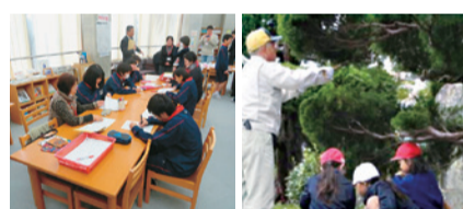
コミュニティ・スクール 地域学校協働活動