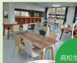
高校生によるカフェ実習