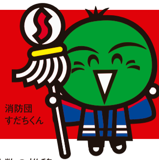
消防団 すだちくん

消防団は、消防組織法に基づいて市町村に設置される消防機関です。消防団員は、それぞれ自分の仕事を持ちながら、地域防災の担い手として地域に密着して活動し、住民の安全と安心を守っています。一方で消防団員数は、少子高齢化やコミュニティの希薄化などを背景に、減少傾向となっていることから、各種イベントでの啓発やプロモーション動画の制作・配信など、消防団員の確保に向けた取組みを推進しています。