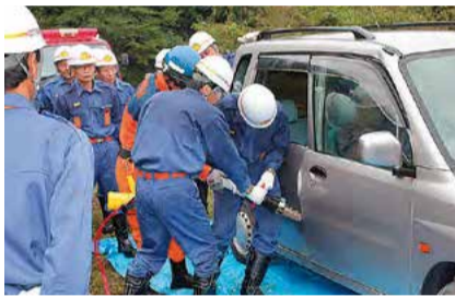
●災害応急活動(救助活動)