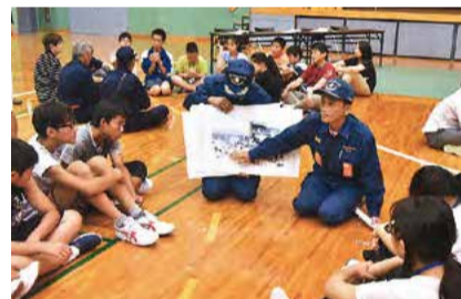
●少年消防クラブの指導