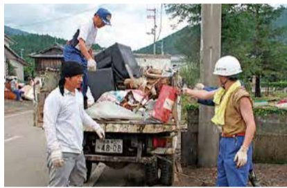
●災害復旧活動(廃棄物処理)