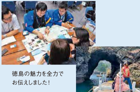
徳島の魅力を全力でお伝えしました！

こうした中、6月18日と19日の2日間、本県で、日本政府観光局主催により、東アジアの旅行会社76社を招いた大規模商談会、「VISIT JAPAN Travel Mart 2019 -EAST ASIA-」が関西・中四国で初めて開催されました。