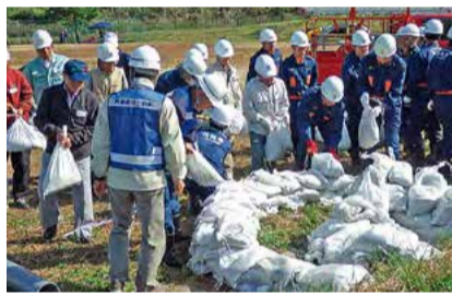
●自主防災組織との連携