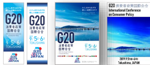
幟・ポスター・チラシ・パンフレット・動画など