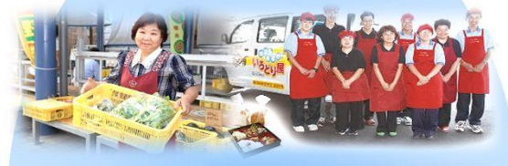
農業と福祉の連携による地域の課題 解決を支援