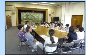
大学、地域住民などが連携し地域 活性化の取組みを推進