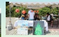
ビーチコーミング教室