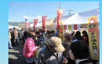
全国井サミットinみなみ