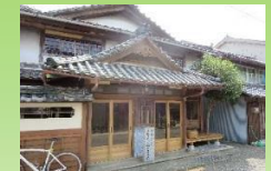
SO交流施設(旧初音湯)