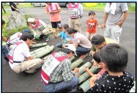
地域特性を踏まえた 実践的訓練の推進