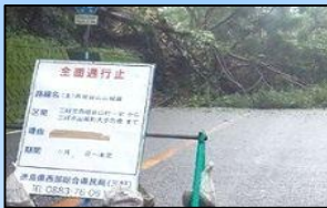
災害対応力の強い観 光地域づくりを推進