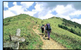
誰もが安全、安心に 登れる山へ