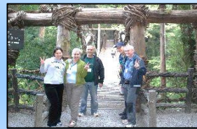
海外への情報発信力強化による誘客促進