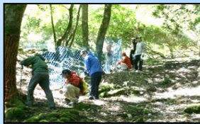
豊かな自然を次世代 へ継承