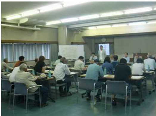
【平成30年6月14日（木） 説明会】

本地区は、平成30年度完了であるため、今後は地元農家を中心となり環境配慮に取り組んでいただけるよう、希少植物の生育位置や留意点について、関係農家に説明を行った。