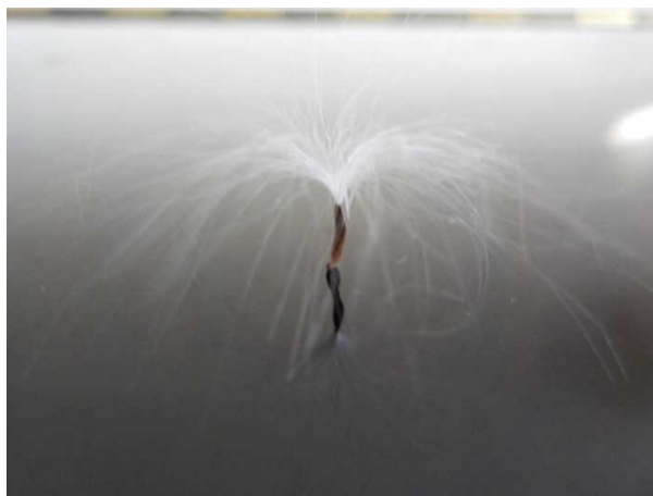
(2) 絹糸状の冠毛のあるコカモメヅル種子