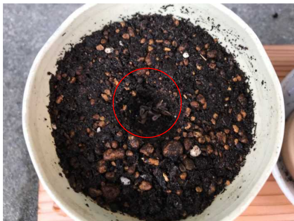
(3) コカモメヅル種子の播種状況