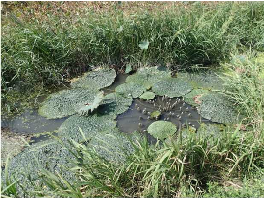
オニバス生育状況

工事前にオニバスの種子を採取し、工事後に元の位置周辺に専門家の指導の下、平成30年4月に播種を実施。播種後の一部のオニバスで、順調に生育し開花も確認された。