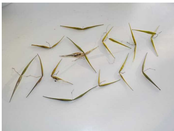
(1) 採取保存していたコカモメヅル種子