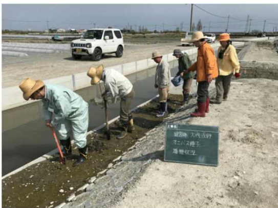
播種状況 (工事後の水路)