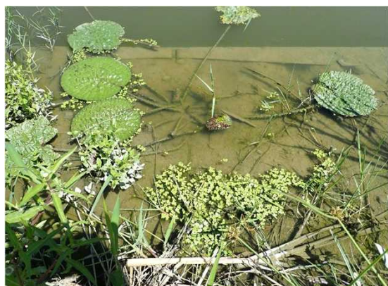
播種後の生育状況 (工事後の水路)