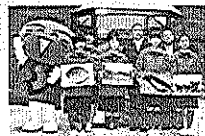
あわっ子文化大使