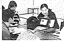
徳島サマースクール