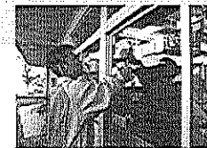
特別支援学校 職場体験実習