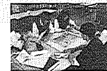
防災クラブの活動 (防災マップ作り)