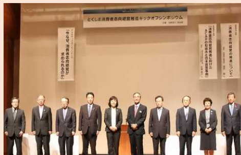
とくしま消費者志向経営推進組織設立(平成29年10月13日)