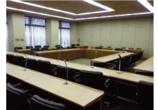
少人数の議員でくわしく調べたい話し合いを行う委員会室 しょうにんずう ぎいん しら はな あ おこな いいんかいしつ