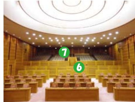
議長席から見た議場 ぎちやうせき み ぎじやう