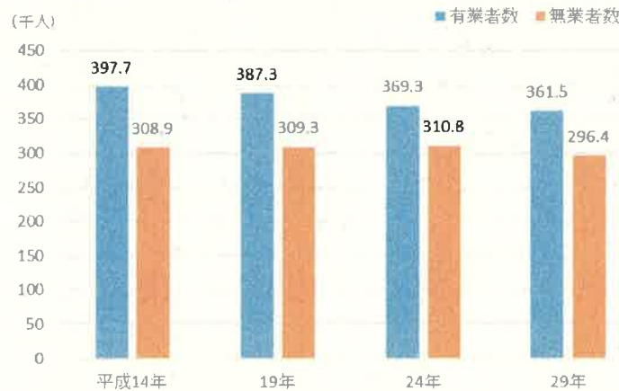
図1-1 徳島県の有業者数及び無業者数の推移（15歳以上）—平成14年～平成29年

注1)「有業者」とは、ふだん収入を得ることを目的として仕事をしており、調査日（平成29年10月1日）以降もしていくことになっている者及び仕事は持っているが現在は休んでいる者をいう。