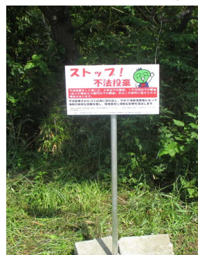
不法投棄防止啓発用看板

海岸における良好な景観及び環境を保全するため、県内の重点区域海岸の海岸漂着物の回収・処理事業を実施するとともに、海岸及び河川において清掃活動と組み合わせた普及啓発活動の実施や啓発用看板の設置など発生抑制事業に取り組みました。(とくしま海岸漂着物地域対策推進事業)