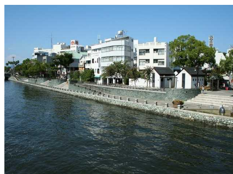
新町川の修景護岸