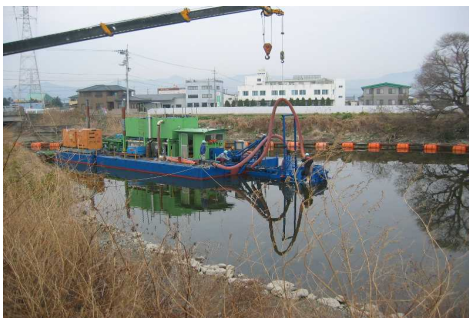
正法寺川の浚渫状況