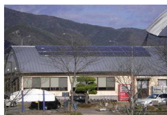
太陽光パネル設置施設

また、電気自動車等の蓄電や発電機能を災害時の非常用電源として有効活用するため、避難所等にV2H（送受電装置）の設置を推進しています。