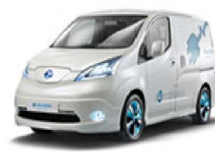
電気自動車等低公害車