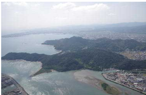
日の峰大神子風致地区

平成26年度末における県下の風致地区の指定状況及び平成26年度中の風致地区内における許可等の件数は表4-2-3のとおりとなっています。