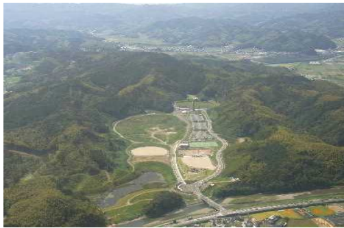
南部健康運動公園

また、都市緑化に対する意識の向上を図るため、「暮らしの緑化推進」絵画コンクールの開催による普及啓発を進めているところです。