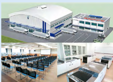
(上部) 右:本館 左:別館 ※H30内完成予定 (左下) 多目的室/災害対策活動室 (右下) 調理室 ※自家発電から電力供給

災害時は自家発電や防災無線、備蓄倉庫など防災活動への多様な設備環境のもと、県西部における「広域応援部隊活動拠点」として、また、南海トラフ巨大地震発生時には沿岸部への「後方支援拠点」として本領を発揮!