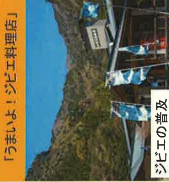
「うまいよ!ジビエ料理店」