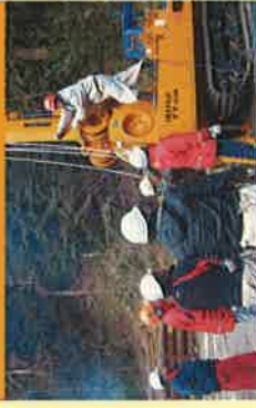
経営管理研修の開催