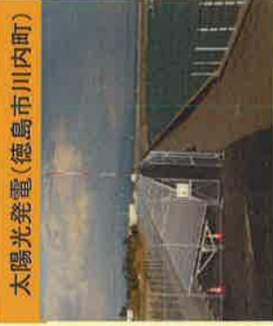
太陽光発電(徳島市川内町)