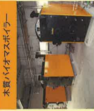
木質バイオマスボイラー