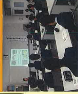
現役漁業者に向けた 実践プログラムの開催