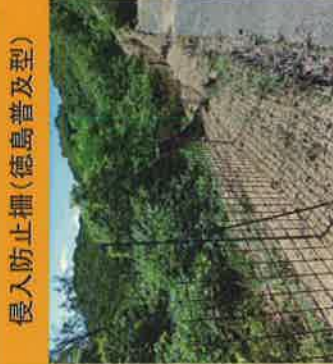
侵入防止柵(徳島普及型)