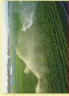
～津波被害に打ち克つブランド産地へ！～