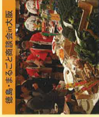
徳島・まるごと商談会in大阪