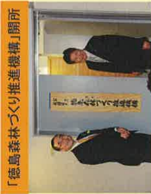
「徳島森林づくり推進機構」開所