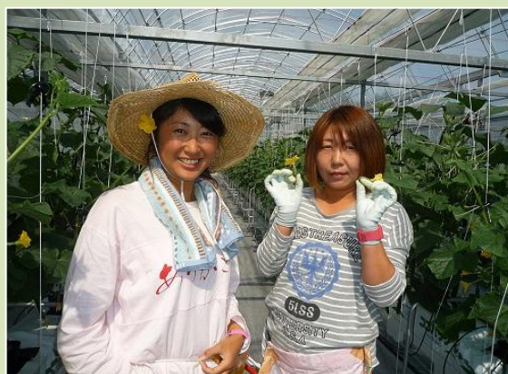
きゅうり女子（海部郡）