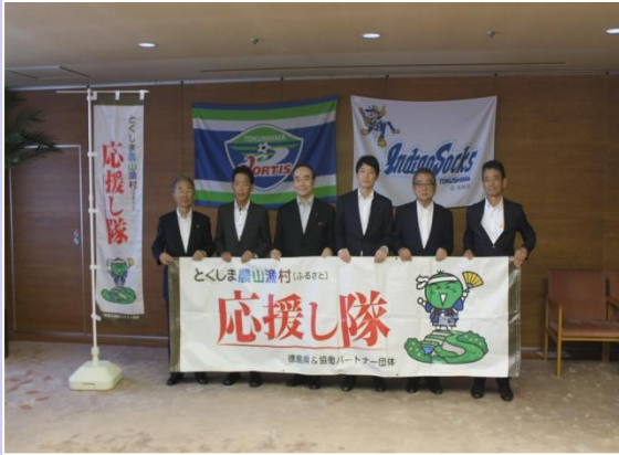
協働パートナー協定式