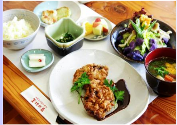
地美栄（ジビエ）料理