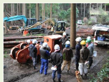
架線研修（フォレストキャンパス）