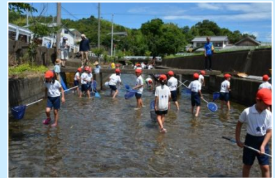
田んぼの学校（国府小学校）