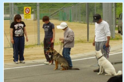
モンキードッグの導入支援