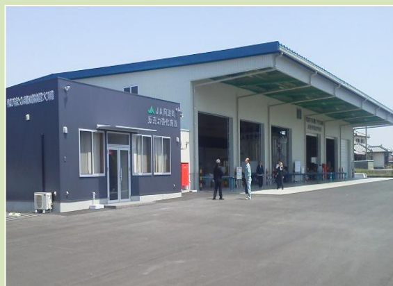
集出荷場の再編（阿波市）