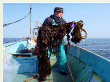
高水温耐性わかめの収穫