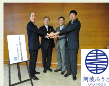
「とくしまブランド推進機構」の設立