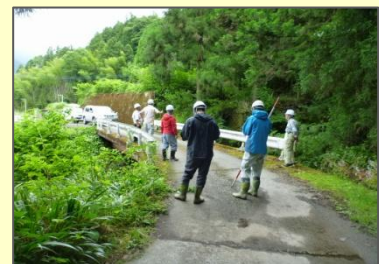
山地災害危険地区の点検パトロール