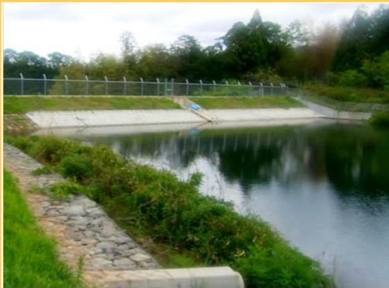
改修された農業用ため池