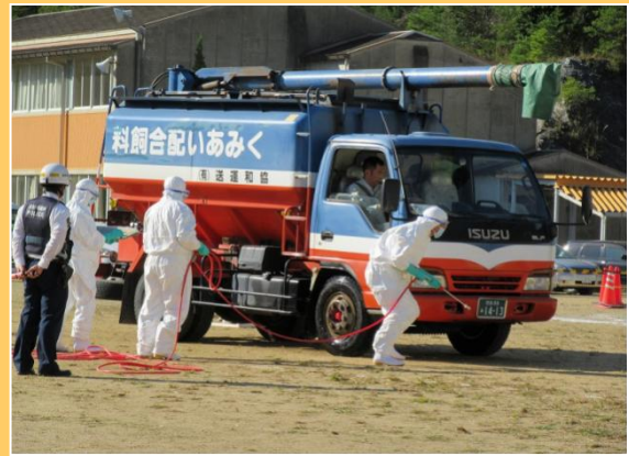
家畜伝染病防疫演習