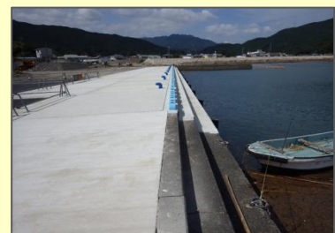
漁港における耐震岸壁の整備（牟岐漁港）