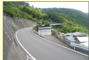
緊急輸送道路を補完する農道