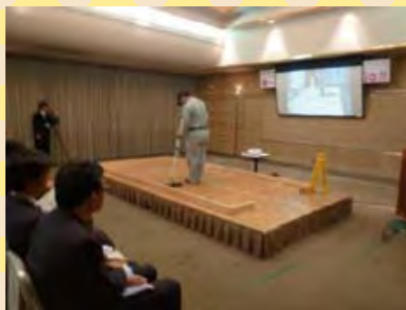
技能検定の様子 (ビルメンテナンス)