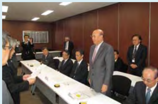
「働き方改革」に向けた要請書を経済 5 団体に手交する様子