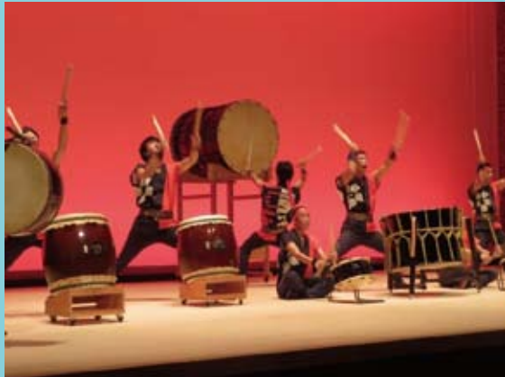
開会行事（国府支援学校和太鼓部演奏の様子）

◆平成28年9月16日(金)、阿波市交流防災拠点施設「アエルワ」において、県西部の就労をめざす特別支援学校生と、企業の採用者らの懇談会が開催されました。西部での『ゆめチャレ』開催は、今年で3回目となります。