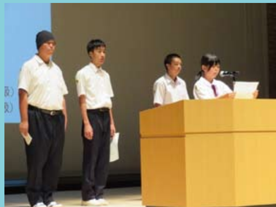
働こう宣言の様子