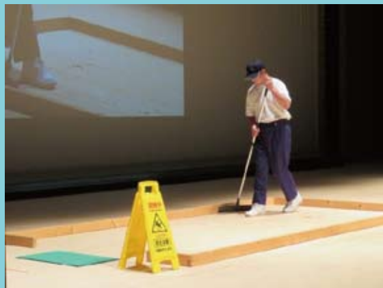
とくしま特別支援学校技能検定の様子