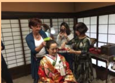
和装のヘアアレンジの訓練