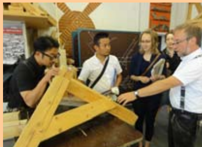
ドイツの建築技術の説明