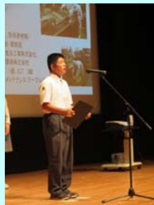
働こう宣言の様子