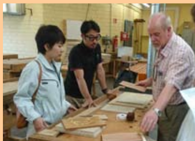
ドイツの木工技術の説明