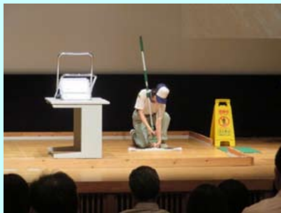
とくしま特別支援学校技能検定の様子