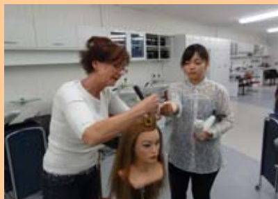
ドイツのヘアパーマの訓練