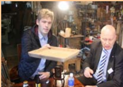
日本の木工加工の説明