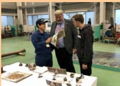
テクノスクールでの訓練の説明