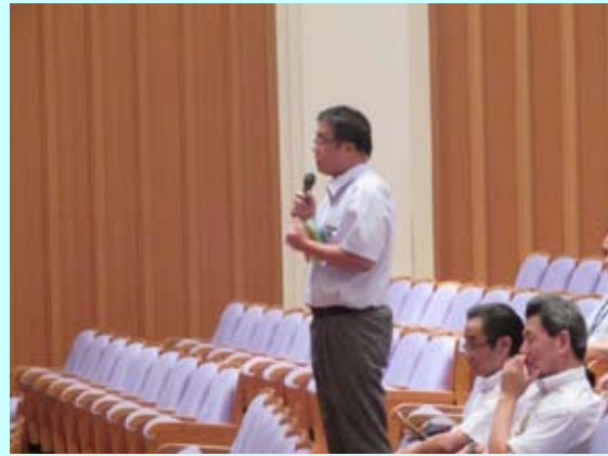
生徒にアドバイスする企業担当者