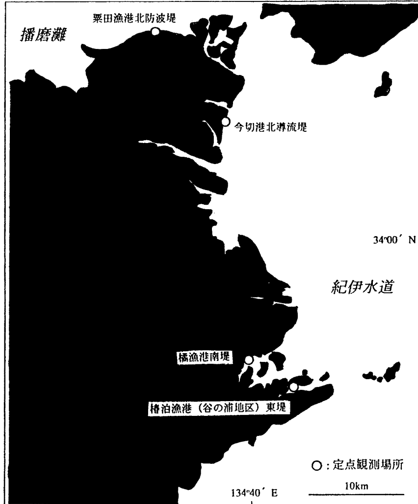
図 1 水産指導員による定点観測地点図

水産指導員による地域定点観測を平成 8 年 4 月～平成 9 年 3 月の間の水温と比重を表わす。水温， 比重の観測時刻は午前 10 時，比重は水温 15 の換算比重を示す。