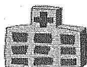
災害医療支援病院

■軽症・中等症患者の受入や災害拠点病院へ医師派遣等を行う医療機関を「災害医療支援病院」として県独自に指定