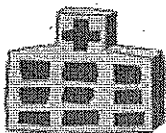
災害医療支援病院