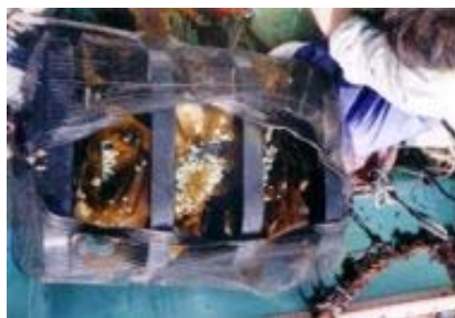
写真2 餌のコンブと稚貝