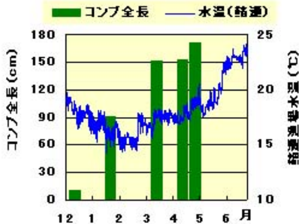
図1 養殖コンブの生長と海水温