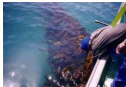
写真3 コンブ養殖状況