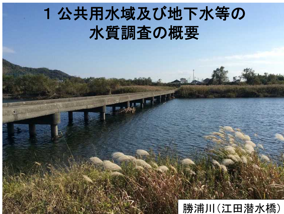
勝浦川(江田潜水橋)